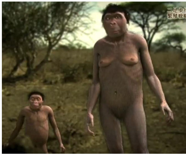
女性: 情動 (共感性)