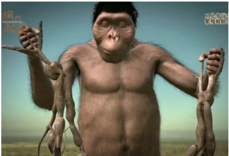
男性: 情報 (論理性)